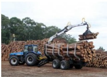
Fotografia 1: Caminhão de Baldeio